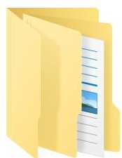
2024年3月15日服装设计学院获奖统计